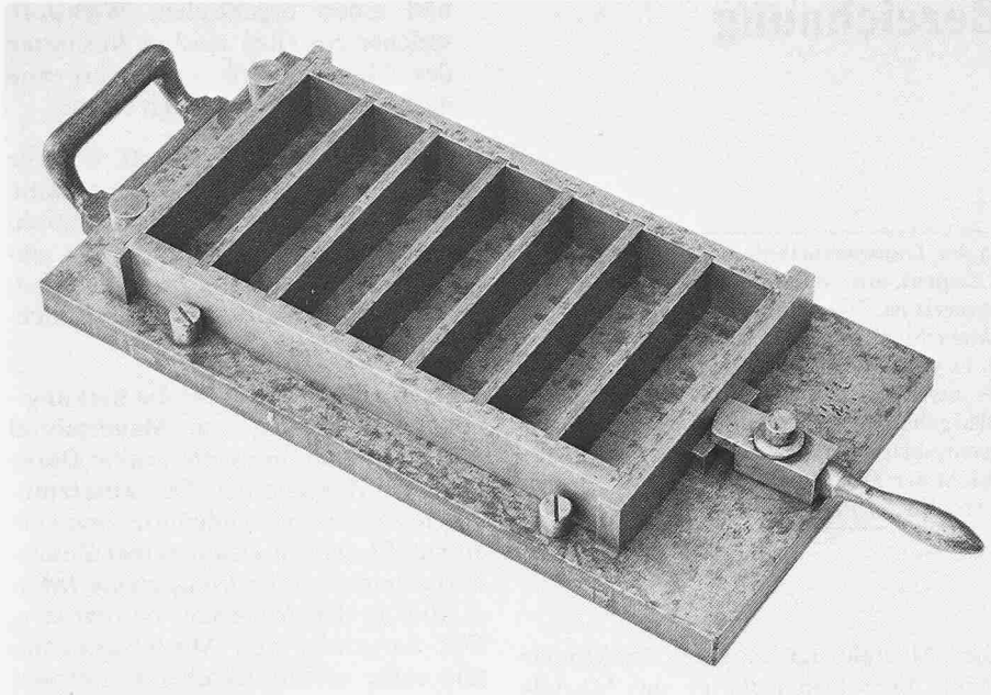
Bild 1. Modellform aus Stahl zur Herstellung von Mörtelprismen mit den Abmessungen 40×40×160 mm