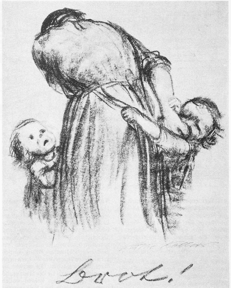
Käthe Kollwitz: «Brot»

In der Generation nach den zwei Weltkriegen nehmen viele die Stadt an, freilich ohne Begeisterung. Sie entdecken nicht wie noch Max Brod «die Schönheit des Pflasters» in ihren Steinen. Sie lassen sich auch nicht täuschen wie einer der expressionistischen Arbeiterdichter, die der Sang der Stadt traf «wie greller Tubaschrei, nicht Hirtenflöte taugt ihm, nicht Schalmei». Unsere