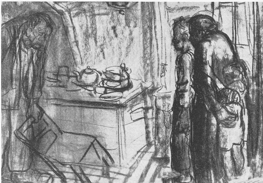
Käthe Kollwitz: «Trinker bedroht Familie»

Heinrich Zille (1885–1929). In volkstümlich humoristischen und zugleich satirisch anklagenden Zeichnungen schilderte er das «Milljöh» des Berliner Proletariats. «Vater Zille» genoss grosse Popularität über die Elendsquartiere hinaus, wo er sein einfaches, arbeitsames Leben grösstenteils in einer zweifelhafte Stube beim Bahnhof Westend verbrachte. Als Autodidakt gewann der Zeichner und Maler Zille (später Mitglied der Akademie) bedeutendes Ansehen. Hierzu trug auch seine Mitarbeit für die «Jugend», den «Simplicissimus» und andere illustrierte Blätter bei.