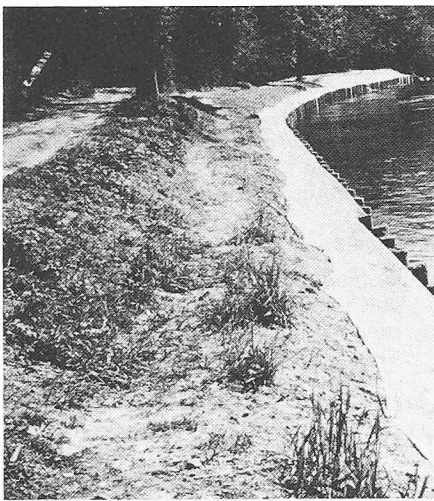
Erosionsschutz an der Reuss

Als Kostenvergleich sei ein Beispiel aufgeführt: