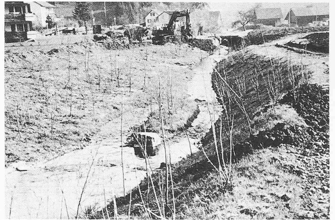
Mülibach Saland, Oktober 1980