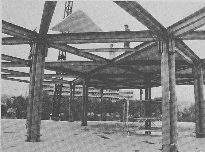
Die vier Grundelemente des Systems: Nahtlos gezogene Rohrstützen, Radial- und Randträger aus gekantetem Stahlblech und der die Radialträger verbindende Stern

die Fassadenelemente oder Trennwände, sondern auch auf Stiegenhäuser, Installationsleitungen usw., die auf Grund der bisher nicht bekannten Genauigkeit nur mehr montiert