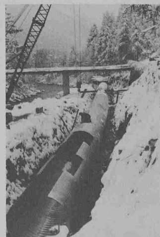
Verlegen des Armco-Durchlaufkanales

Mit dieser technisch anspruchsvollen Leistung und der die Umwelt nicht belastenden Konstruktion dürfen die Einwohner von Randa und dem hinteren Mattental zuversichtlich dem nächsten Winter entgegensehen.