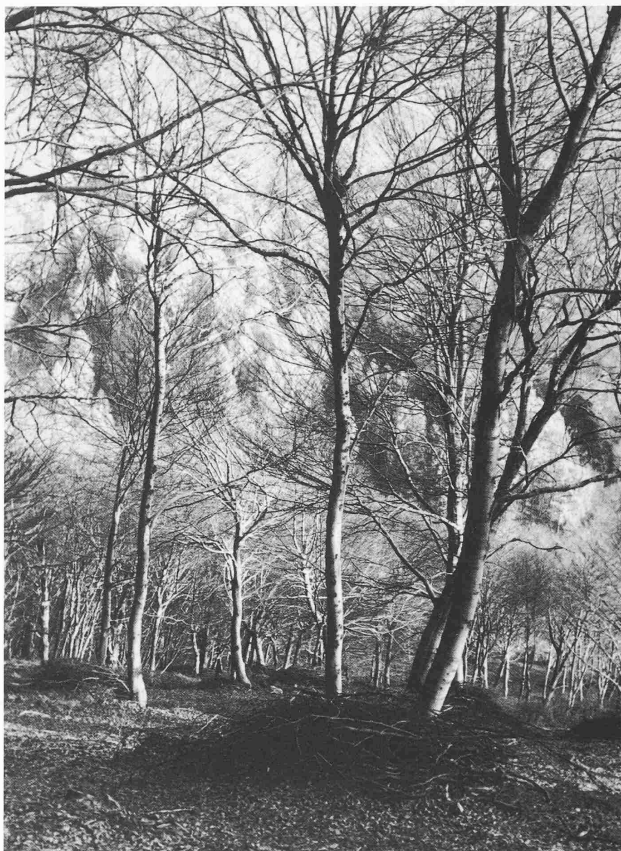
In diesem Schlagwald (Buchen) wird eine Umwandlung vorgenommen; so können die Bäume das Sonnenlicht optimal nutzen

Diese Zahl muss allerdings um etliches nach oben korrigiert werden, bezieht sie sich doch nur auf das verkaufte Holz. Mehr als ein Drittel des geschlagenen Holzes wurde nicht verkauft, sondern für den Eigenbedarf verwendet (Zuteilungen an Grundbesitzer, Private usw.); wenn man dieses Holz in die Rechnung mit einbezieht, ergibt sich ein geschätzter Bruttoerlös von insgesamt etwa 6 Mio Franken. Im Vergleich zur Produktionsfläche ist das eine eher bescheidene Zahl, tatsächlich ist der Hektarertrag weitaus der kleinste in der ganzen Schweiz.