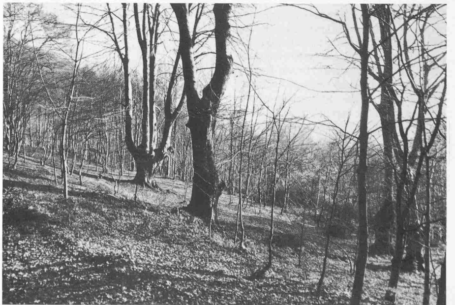
In der ganzen montanen Stufe des Tessins (800–1400 m ü.M.) herrscht die Buche vor. Besonders erholsam ist dieser junge Buchenwald durch die Anwesenheit der würdigen alten Exemplare

Man darf behaupten, dass der Tessiner Wald heute eher für seine gesellschaftliche als für seine wirtschaftliche Funk-