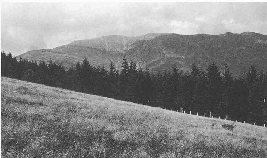
Fichtenpflanzung in der Val Colla (1400 m ü.M.). Der Nadelwald beeinträchtigt das Landschaftsbild nicht