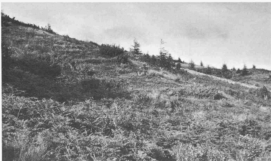
Die ungenutzte Weide vergandelt. Spontan haben sich Farn, Ginster, Lärche, Tanne und Wacholder angesiedelt

tion bekannt ist, und selbst wenn diese an Wichtigkeit gewinnen sollte, würden die Verantwortlichen jene andere kaum aus den Augen verlieren. Schon heute berücksichtigen die Förster diesen Aspekt in der Planung von Grünzonen, wo die Erholungsfunktion in den Vordergrund treten darf. Auch bei der Planung von Erschliessungsstrassen und -wegen werden die Bedürfnisse des Tourismus einbezogen (Aussichtspunkte, Landschaftspflege), und nicht zuletzt können auch die eigentlichen waldbaulichen Massnahmen wie Hiebe oder die Artenwahl bei Wiederaufforstungen den Reiz eines Erholungsgebietes beeinflussen.