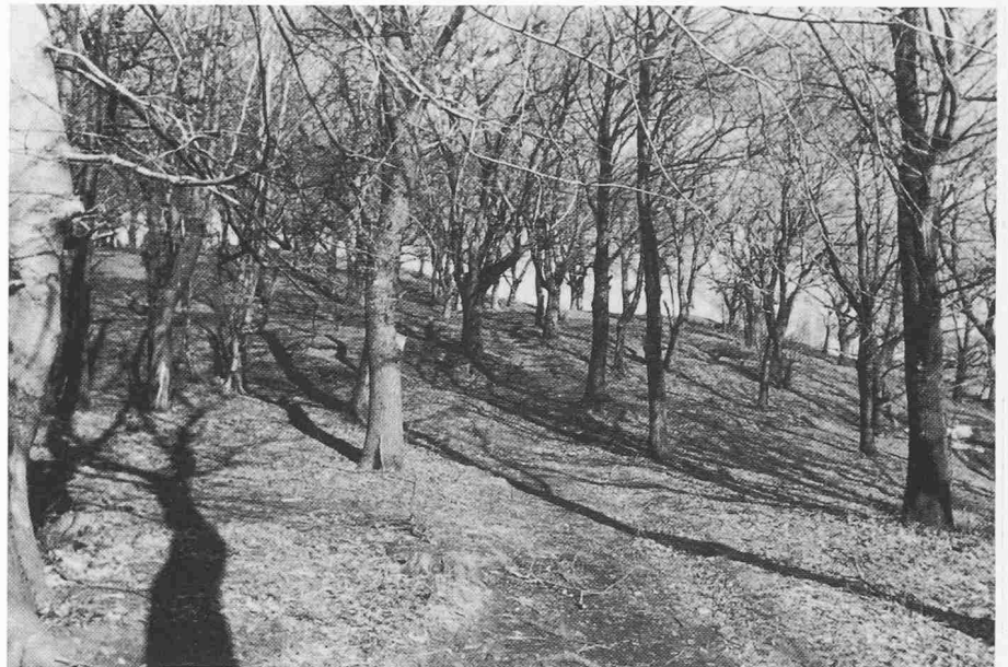
Ein schöner Kastanienhain. Einst waren sie rund um die Dörfer sehr häufig, heute trifft man sie eher selten

Um den Erholungs- und Freizeitbedürfnissen der heutigen Menschen zu genügen, benötigt der Wald eigentlich