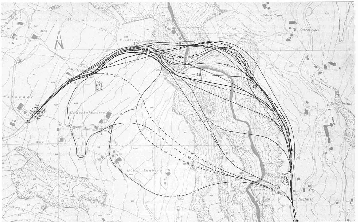
Varianten der Linienführung