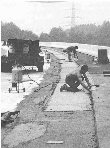
Verlegungsarbeiten der PBD-Bahnen

liniengefälle zu genügen. Zur Vermeidung von Schäden infolge Blasenbildung muss bei diesen Systemen eine hohe und vollflächige Haft-Zug-Festigkeit zwischen den verschiedenen Kontaktflächen gewährleistet sein.