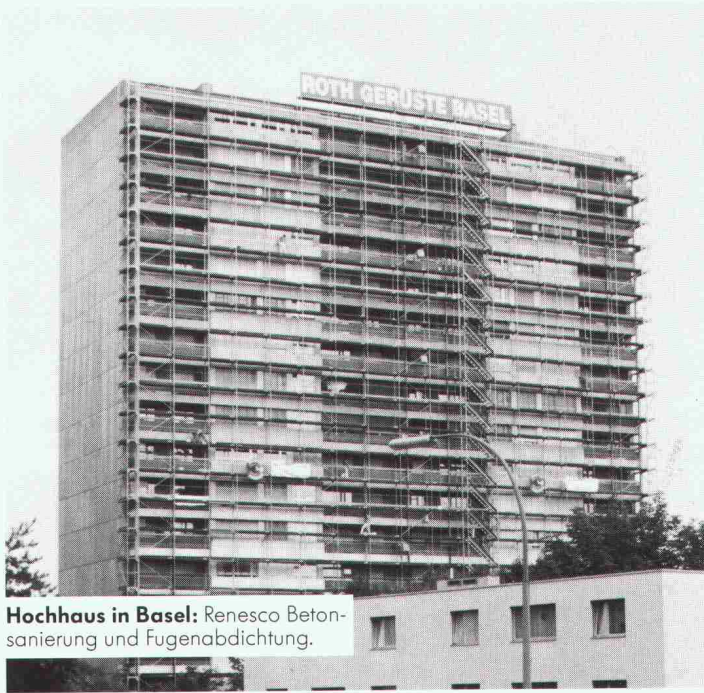
Hochhaus in Basel: Renesco Betonsanierung und Fugenabdichtung.