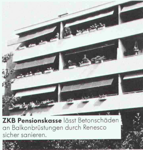
ZKB Pensionskasse lässt Betonschäden an Balkonbrüstungen durch Renesco sicher sanieren.