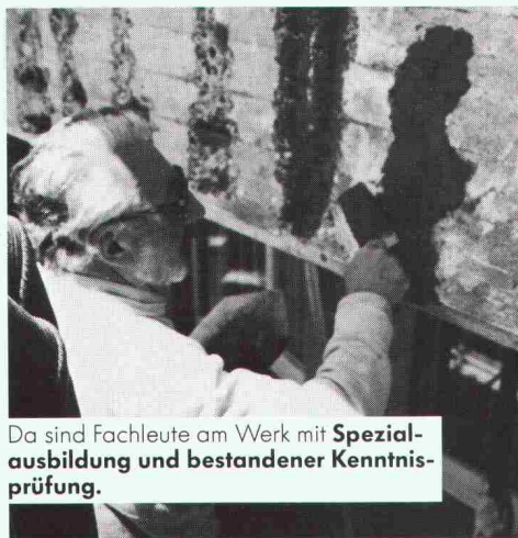
Da sind Fachleute am Werk mit Spezialausbildung und bestandener Kenntnisprüfung.