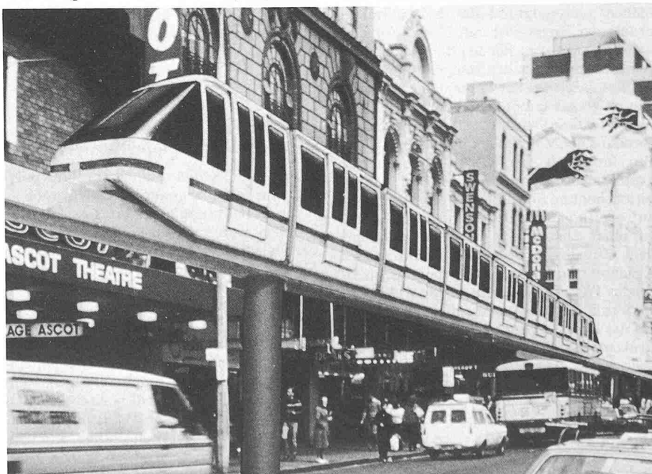
Fotomontage mit der Innenstadt von Sydney

das Monorail den Stadtkern und das Einkaufszentrum von Sydney mit dem Naherholungsgebiet Darling Harbour verbinden und pro Stunde 4000 bis 5000 Personen befördern können. Die in Ausstellungen und Freizeitparks weltweit erprobte Schweizer Monorail-Technologie wird damit erstmals für den öffentlichen Verkehr eingesetzt. Anfangs 1988 soll die 52 Millionen Franken teure Anlage in Betrieb genommen werden. Ebenfalls aus Australien stammt der Auftrag für ein weiteres Monorail, das den Personentransport innerhalb der Weltausstellung 1988 in Brisbane sicherstellen wird.