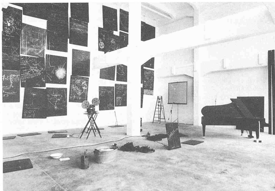
Joseph Beuys: «Das Kapital, Raum 1970-1977», 1980/84. Installation in den Hallen für neue Kunst, Schaffhausen

Führungen: Jeden 1. Sonntag der Monate Mai bis Oktober, 11 Uhr. Zusätzliche Führungen für private Interessenten, Vereinigungen, Schulklassen usw. (auch ausserhalb der Öffnungszeiten) können beim Sekretariat angemeldet werden. Hallen für neue Kunst, Baumgartenstrasse 23, 8200 Schaffhausen, Tel. 053/5 25 15.