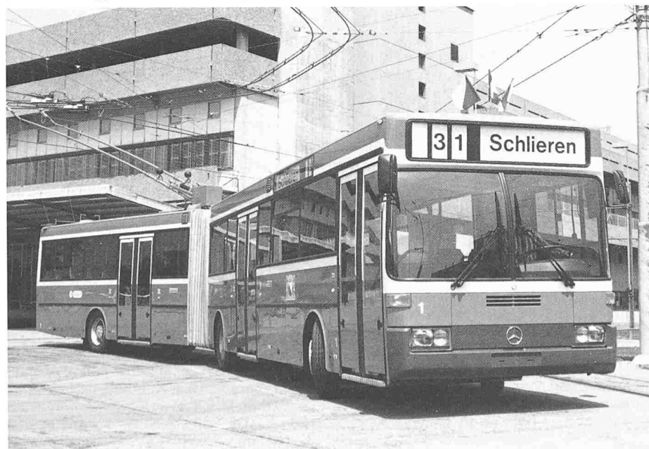
Bild 1. Prototyp des neuen VBZ-Trolleybus aus der Mercedes-Busfamilie

Dieser Schub-Gelenk-Trolleybus wurde den Zürcher Verkehrsbetrieben am 18. Juni 1986 ausgeliefert. Somit verfügt Zürich über den