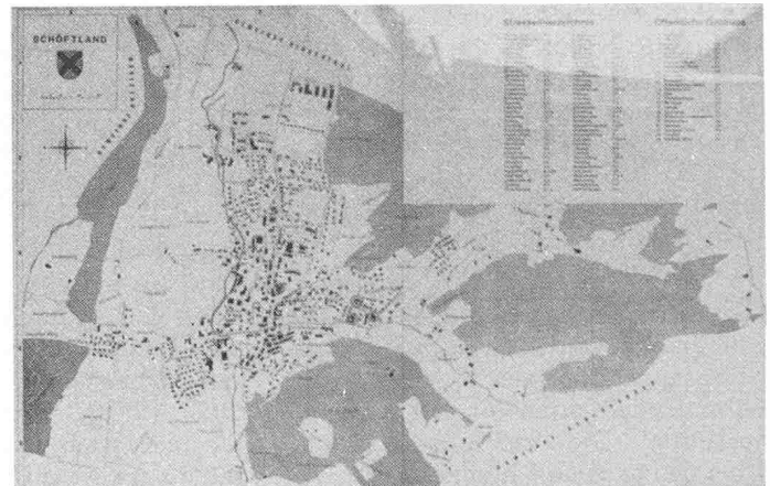
Bild 4. Beispiel betreffend Information: Ortsplan, mit Angabe der Standorte wichtiger Einrichtungen (Schöftland AG)