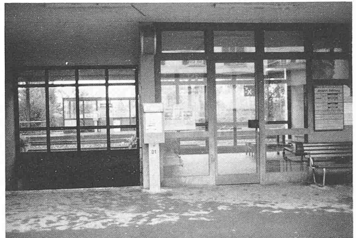
Bild 3. Warteraum mit guter Einsicht auf Bus und Zug (Wartesaal Uerikon ZH)