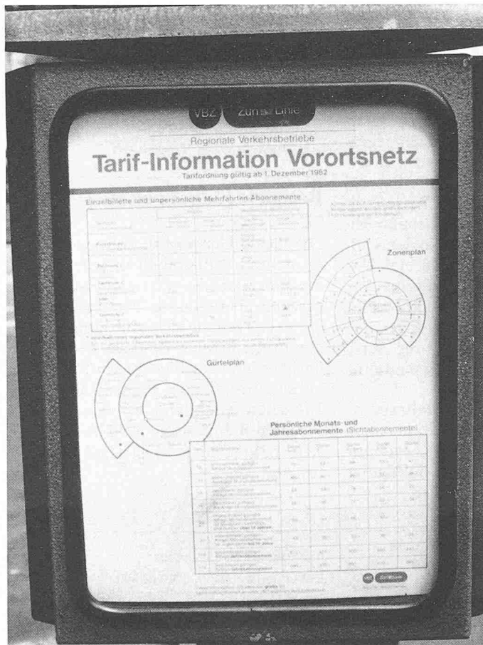
Bild 5. Beispiel betreffend Information: Tarifplan der Buslinien (Tafel der Verkehrsbetriebe der Stadt Zürich)