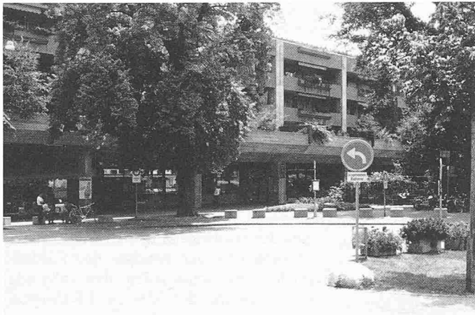
Bild 2. Gutes Erscheinungsbild und urbane Dichte (Wohnüberbauung, Bahnhof Dietikon ZH)