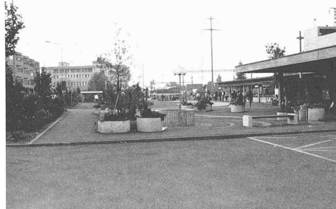
Bild 8. Beispiel betreffend Sicherheit: Trennung von ruhendem und rollendem Verkehr (Schlieren ZH)