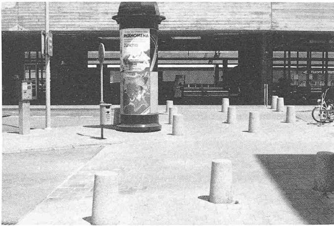
Bild 9. Beispiel betreffend Sicherheit: Fussgänger-Übergang bei geringem Motorfahrzeug-Verkehr (Zürich-Altstetten)