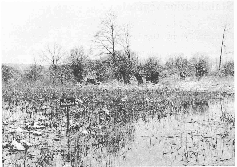
Kopfweidenhain an der Alten Ziel bei Meienried (BE)