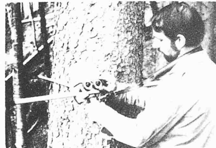
Bastringue; codeur perforateur portatif pour la saisie de données

mogène et géographique de la propriété et l'état actuel de la forêt;