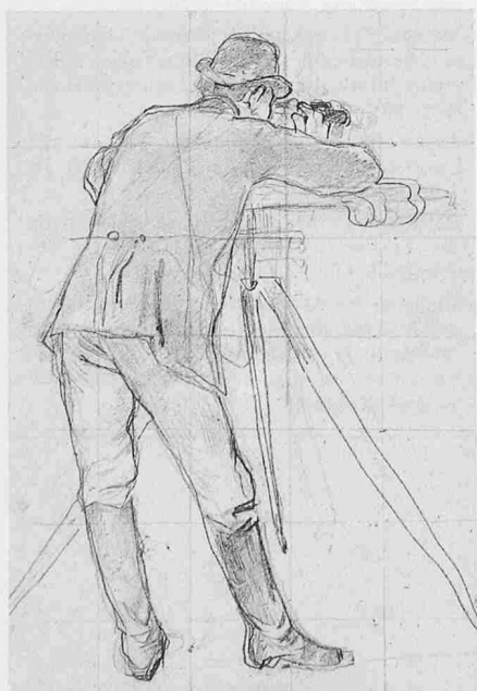
Albert Anker: Skizze zu Der Geometer, 1885. Privatbesitz

Der Hauptmann hatte alles wohl überlegt und gemessen und brachte jenen Dorfweg, jene Mauer am Bache her, jene Ausfüllung wieder zur Sprache. Ich gewinne, sagte er, indem ich einen bequemen Weg zur Anhöhe hinaufführe, gerade soviel Steine, als ich zu jener Mauer bedarf. Sobald eins ins andre greift, wird beides wohlfeiler und geschwinder bewerkstelligt.