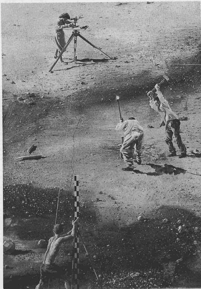
Hans Erni: Die Umgestaltung der Wüste, 1945. Hans Erni-Museum Luzern