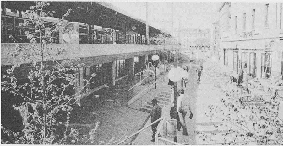
Die neuen Perronanlagen des Genfer Bahnhofs für die Flughafenlinie gegen den Place du Reculet gaben diesem ein sehr viel freundlicheres Gesicht