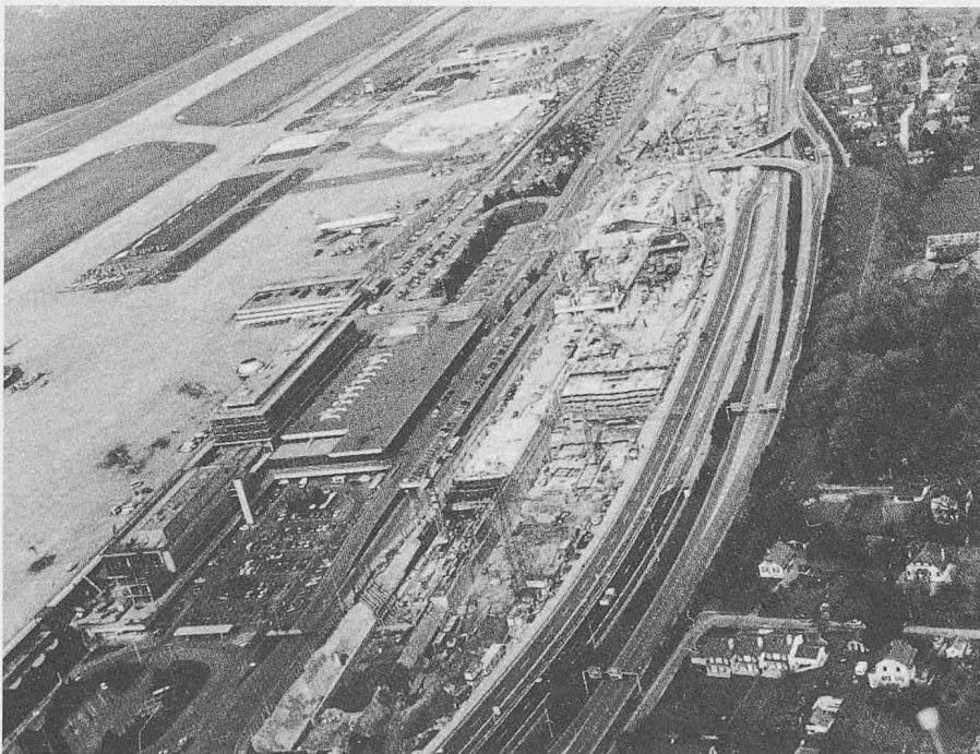
Luftaufnahme der Bahnhof-Baustelle am Genfer Flughafen Cointrin

rectement vers Lausanne par une boucle rejoignant en amont de Genève la ligne des rives du Léman. Une telle boucle a également été évoquée lors de discussions sur les transports publics régionaux. Il faut à ce sujet constater que Genève-Cointrin est une tête de ligne. Les trains n'en repartent pas immédiatement vers le nord ou l'est de la Suisse: ils subissent nettoyyages et contrôles usuels avant que les voyageurs s'y installent à nouveau. D'autre part, l'inversion systématique des trains serait difficilement compatible avec les critères bien précis auxquels répond la composition des convois.