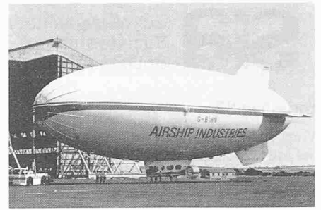
Die Helium-Reinigungsanlage für dieses Luftschiff enthält einen von Sulzer, Farnborough (GB), gelieferten MSB-Kompressor.

(pd) In der neuen Heliumreinigungsanlage, die kürzlich von Costain Petrocarbon für die Basis Cardington der Airship Industries U.K. gebaut wurde, ist ein von Sulzer, Farnborough (Grossbritannien), gelieferter MSB-Kompressor eingebaut. Der Kompressor hat folgende Betriebsdaten: Ansaugdruck 1,013 bar, Saugvolumen 140 m 3 /h, Förderdruck 45 bar.