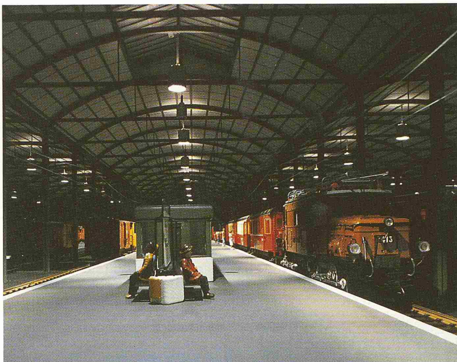
Bild 3. Beleuchtungsversuch am Modell

Zur Erreichung der angestrebten Lichtverteilung könnten auch bisherige Be-