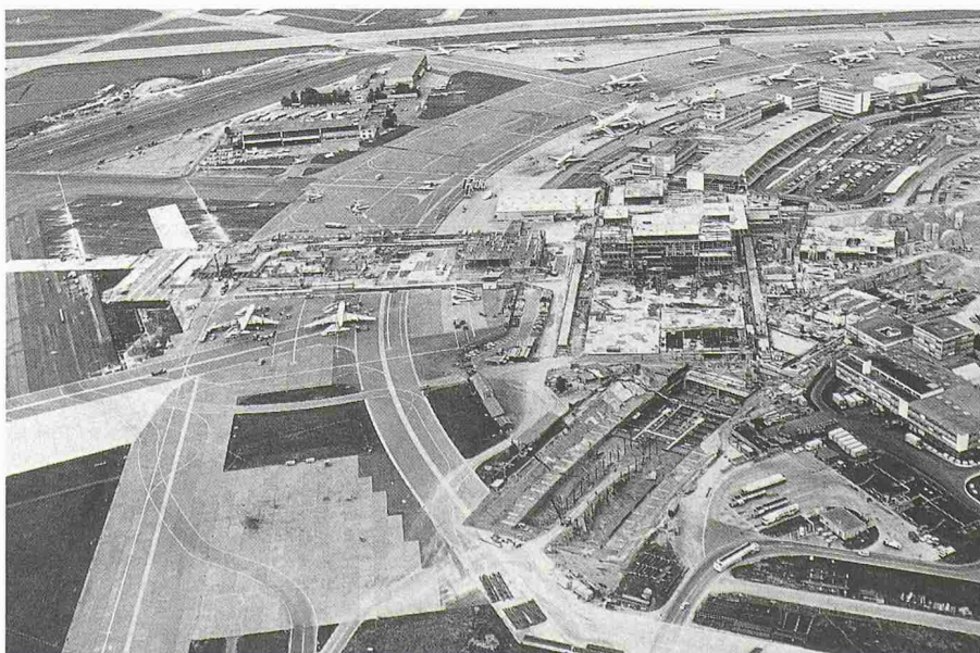
Bild 2. 1973 glich der Flughafen während der dritten Ausbauetappe einer riesigen Baustelle. Terminal, Findexdock und Parkhaus B wachsen empor, die Baugrube der SBB-Flughafenlinie (im Vordergrund) liegt noch offen da