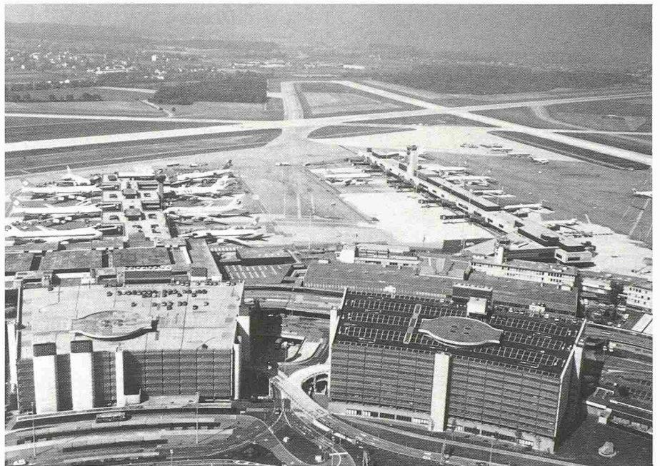
Bild 3. Blick auf die Parkhäuser, Terminals und Fingerdocks A (rechts) und B (links). Gegen Ende des Fingerdocks A erkennt man den 1986 in Betrieb genommenen neuen Kontrollturm, der den alten Turm auf dem ursprünglichen Aufnahmegebäude (Mitte rechts) nach über 30 Jahren ablöste

Für die Zukunft drängen sich Erweiterungen der Frachtanlagen auf, wobei das dem Zürcher Volk 1987 vorgelegte Projekt Schiffbruch erlitt. Dieses «Nein» aber ist wohl eher als ein «nicht so, sondern anders» zu beurteilen. Deshalb ist anzunehmen, dass die Geschichte des Flughafens mit dieser kurzen Bestandesaufnahme der letzten vierzig Jahre kaum endgültig abgeschlossen sein wird. Ho