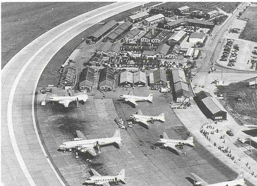
Bild 1. Von 1948 bis zur Eröffnung des Flughafes im Jahr 1953 wurden Passagiere und Fracht behelfsmässig in Baracken abgefertigt, und die Zuschauer standen einfach hinter einem Zaun. Im Vordergrund Flugzeuge der damaligen Zeit: Convair 240, DC-6, DC-2 (links); DC-3 (rechts)

Aber auch dieses grosse neue Bauvolumen genügte dem ständig wachsenden