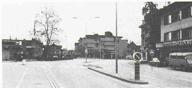
Der gleiche Platz heute: es heisst nur noch rechtzeitig einspüren... (Bilder aus: «Münsingen, Erinnerung und Gegenwart»)