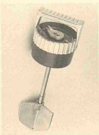
Konsistenzmessgerät Plastimeter P 86