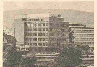
Filara-Fassade für einen Versicherungsneubau in Zürich-Altstetten