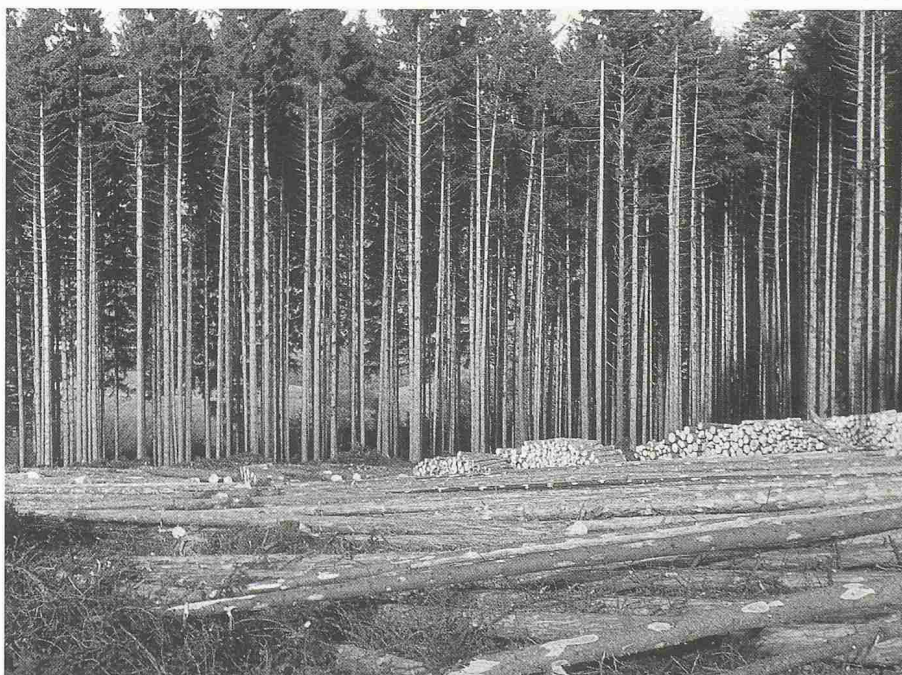
Bild 7. Durch die Anlage künstlicher Monokulturen im Kahlschlagbetrieb wird das natürliche Wald-Ökosystem zerstört. Wälder solcher Art sind für den Naturschutz wertlos und selber zahlreichen Gefährdungen aller Art ausgesetzt. Bild: Fichten-Monokultur auf einem natürlichen Laubmischwald-Standort im Mittelland

Was die forstgesetzliche Forderung der dauernden Erhaltung der Waldbestockungen und Erfüllung der Schutzfunktionen der Wälder betrifft, bedarf der natürliche oder naturnah aufgebaute Wald hierfür keiner menschlichen Pflege bzw. Nutzung. Auch ohne sie ist er in der Regel durchaus in der Lage, diesen Anforderungen nachhaltig zu genügen. Nur an relativ wenigen Orten, wo ein Waldteil in steilem Gelände unmittelbar zum Beispiel eine Siedlung zu schützen hat, können seine Überwachung und zielgerichtete Pflege unumgänglich sein – und auch in solchen Fällen wohl nur dann, wenn er früher als naturferner gleichförmiger Bestand ausgeformt oder gar als Monokultur angelegt worden war. Andererseits sind vom Menschen nicht genutzte, natürlich aufgebaute Waldteile, die dann auch nicht durch Transportanlagen erschlossen zu werden brauchen, für den Naturschutz, zur Erhaltung des natürlichen Artenreichtums und für den ökologischen Ausgleich in der Natur von gröss-