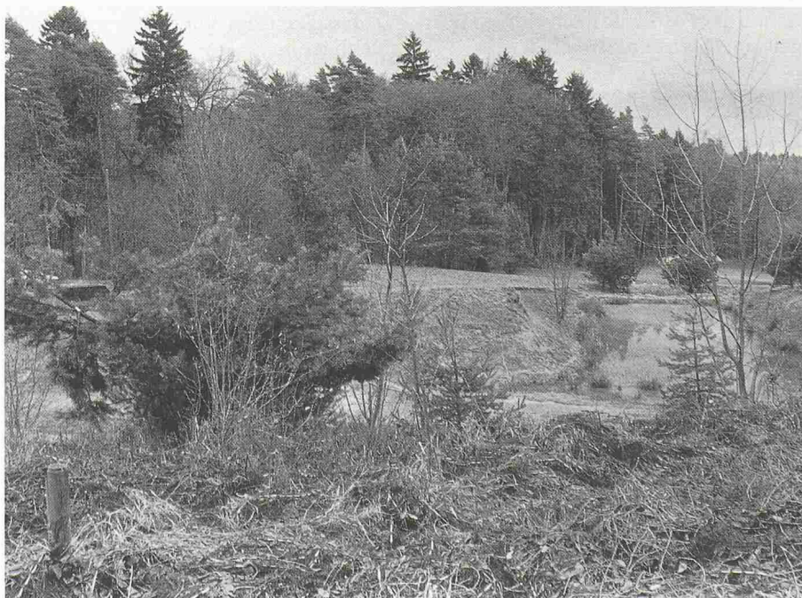
Das «Färberwisl», ein ehemaliges Lehmgrubenareal in Beringen

Bisherige Preisträger: 1984 Bex VD und Elsau ZH; 1985 Bever GR; 1986 Cavergno und Bignasco TI (Val Bavona).