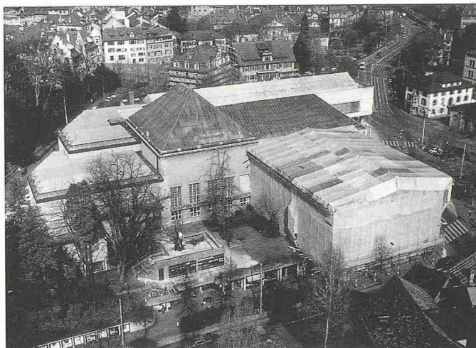
Die Sanierungsarbeiten am Zürcher Kunsthaus gehen in diesem Herbst ihrem Ende entgegen