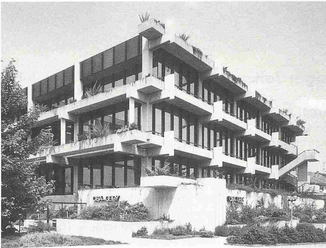
Bild 4. Das Verwaltungsgebäude der Ciba-Geigy in Basel (Architekt: Burckhardt und Partner) empfängt Besucher und Angestellte mit viel Grün