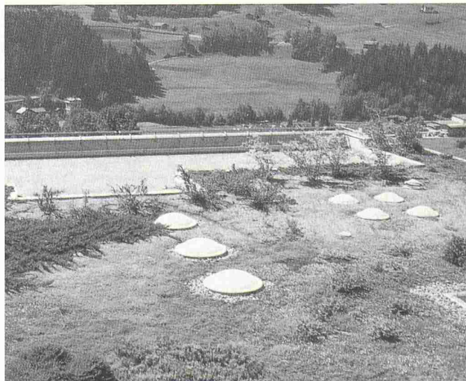
Bild 2. Heute ist auf Flachdächern fast alles möglich: Vom Kräutergarten bis zur «Parklandschaft» kann die Palette reichen