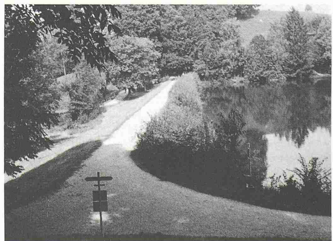
Im Norden und im Westen wird der Günsensee von Dämmen abgeschlossen. Um die Standfestigkeit und Dichtigkeit zu gewährleisten, mussten die inzwischen grossgewachsenen Bäume entfernt werden. In der Mitte der Dämme (unter dem Weg) wurde eine 2,5 m tiefe Beton-Trennwand eingelassen, um die Dämme abzudichten (im Bild: der Westdamm)