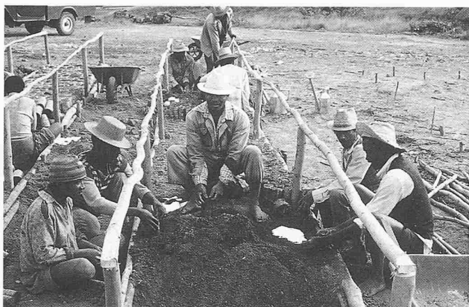
Bild 4. Kleinbaurneigene Baumschule, Programme d'appui au reboisement villageois, Madagaskar