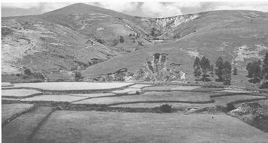
Bild 1. Die Reisfelder sind infolge Erosion der Talseiten von Versandung bedroht. Programme d'appui au reboisement villageois Madagascar

Da sich IC bewusst beschränkt, gibt sie eine Vielzahl von Aufträgen der nicht IC-spezifischen Fachbereiche (z.B. Bauwesen) oder sehr spezialisierte Aufgaben an schweizerische Ingenieurunternehmen und Beratungsfirmen weiter. Schliesslich ist IC über den Vorstand und konkrete Beratungsmandate eng mit den operationellen schweizerischen Hilfswerken verbunden.