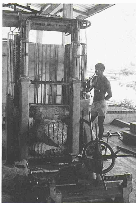
Bild 3. Ausbildung an der Bandsäge, Centre forestier de formation professionnelle de Morondava, Madagaskar

Die Ausbildung höherer Forstkader ist an der Abteilung «Eaux et Forêts» der Landwirtschaftlichen Hochschule Antananarivo angesiedelt. Diese Ausbildung leidet am Mangel, dass sie nicht auf die lokalen Bedürfnisse ausgerichtet ist. Zudem entstand eine klare Lücke zwischen Kadern, die in den 60er Jahren in Frankreich ausgebildet wurden und den jungen, in Madagaskar selbst ausgebildeten Kadern.