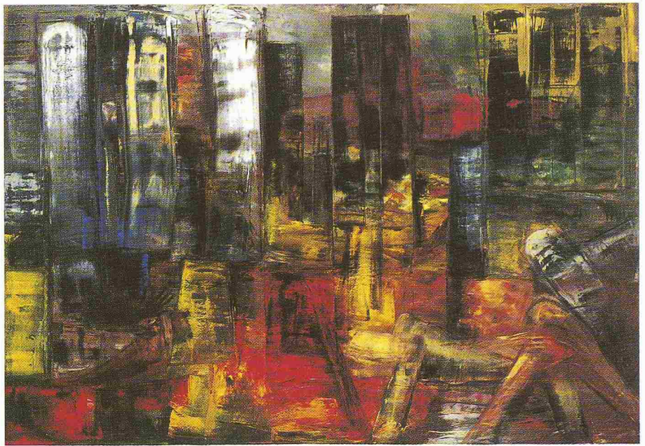
Die Stadt, Klaudia Schifferle, 1989