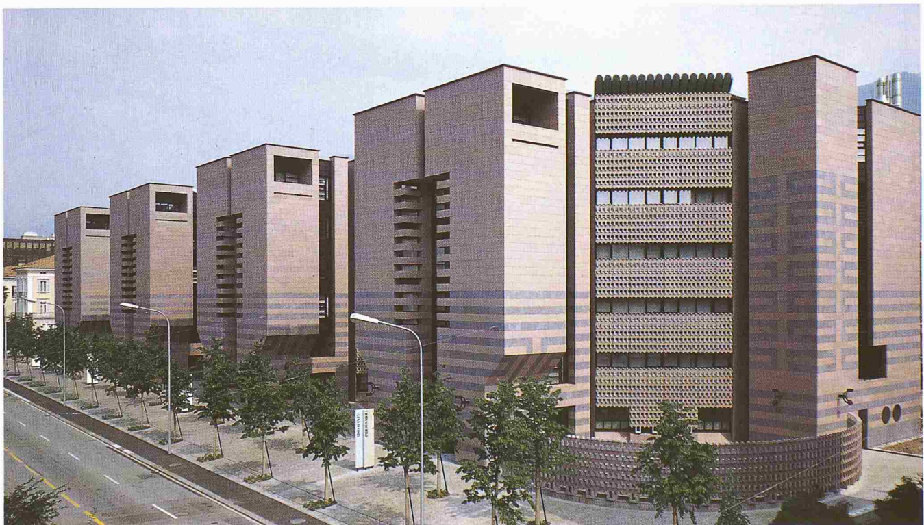
Die Hauptfront der Banca del Gottardo in Lugano, ein Botta-Bau, der im November 1988 eingeweiht wurde