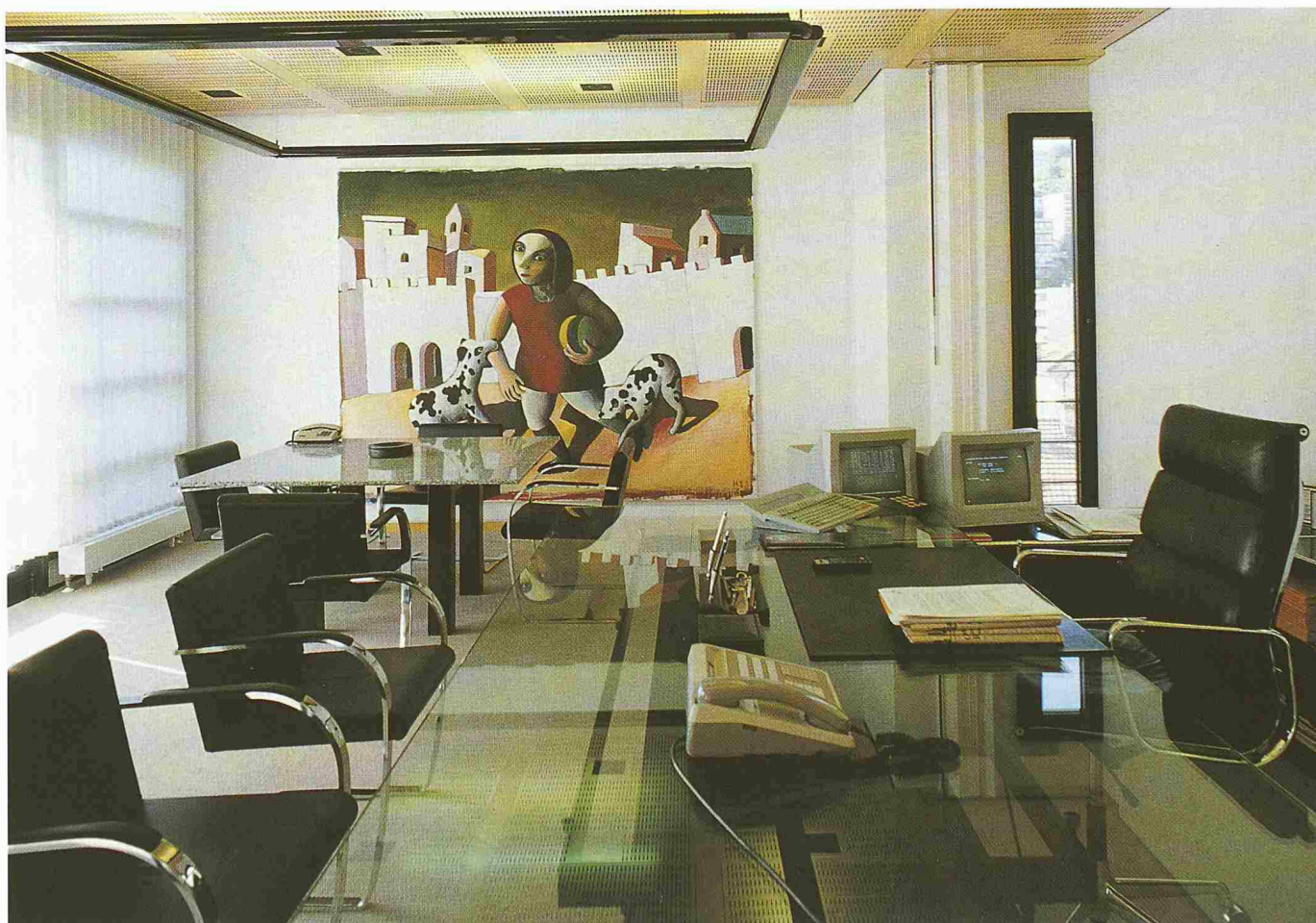
Zeitgenössische Kunst und modernes Bürodiesign: ein Werk von Andreas Hofer, das ein von Hunden angefallenes Mädchen darstellt

Das Risiko, dass aus den jungen Künstlern keine berühmte ältere werden, ist klar. Eine Wertsteigerung der angekauften Werke durfte deshalb nie ein Kriterium sein. Das Urteil über Qualität ist bei diesen Regeln schwieriger als beim Kauf von Kunst, die seit 20 Jahren bekannt oder sukzessive anerkannt ist.