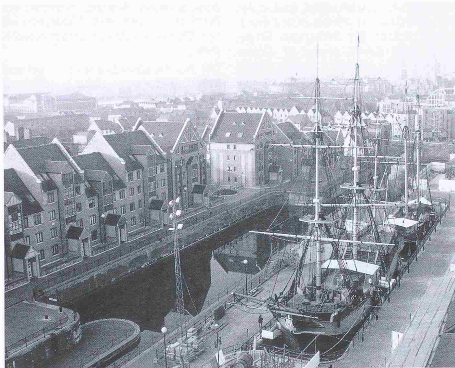
London's Tobacco Dock heute: Eine neue Siedlung im Stil der ursprünglichen Bauten entstand rings um die alten Gewölbe, in denen einst Tabak, Weine und Spirituosen gelagert wurden. Im Zentrum der Siedlung liegen die Nachbildungen zweier Schiffe aus dem 18. Jahrhundert