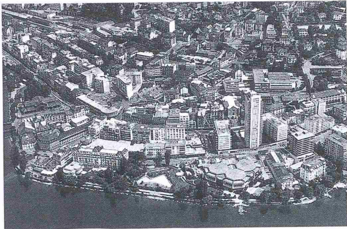
Die Flugaufnahme von Montreux kann gewisse städtebauliche Sünden nicht verdecken. Die Verleihung des Wakker-Preises 1990 soll hingegen der Wende in den Auffassungen von Bevölkerung und Behörden zur Pflege der vom 19. Jahrhundert geprägten baulichen Struktur die gebührende Beachtung verschaffen