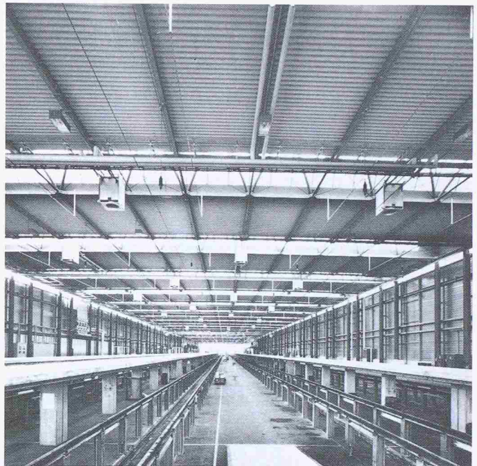
Bild 2. Innenansicht der grossen Halle