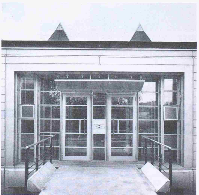
Bild 4. Haupteingang