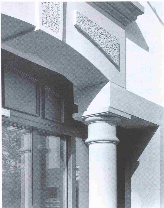
Bild 2. Detail Eingang