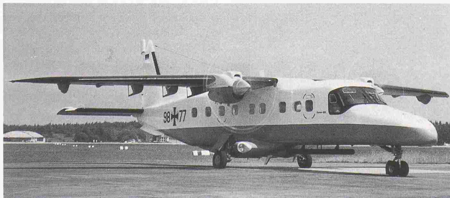
Dornier 228-212 als Öljäger im Einsatz gegen Meeresverschmutzer

Besonders in den Westschweizer Kantonen, welche in den vergangenen Jah-