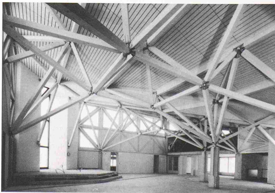
Die Kirche «St. Katharina von Siena» in Fällanden grenzt an ein Naturschutzgebiet. Im Innern steigern sich die Raumhöhen entsprechend der Bedeutung und werden im hohen Kirchenraum von einem sprengwerkartigen Raumfachwerk gleich einem Himmelsgewölbe überspannt

Bauherr: Röm. Kath. Kirchgemeinde Dübendorf Architekten: Peter Brader, Urs Nüesch, Schwerzenbach Ingenieur: Desserich + Partner, Luzern