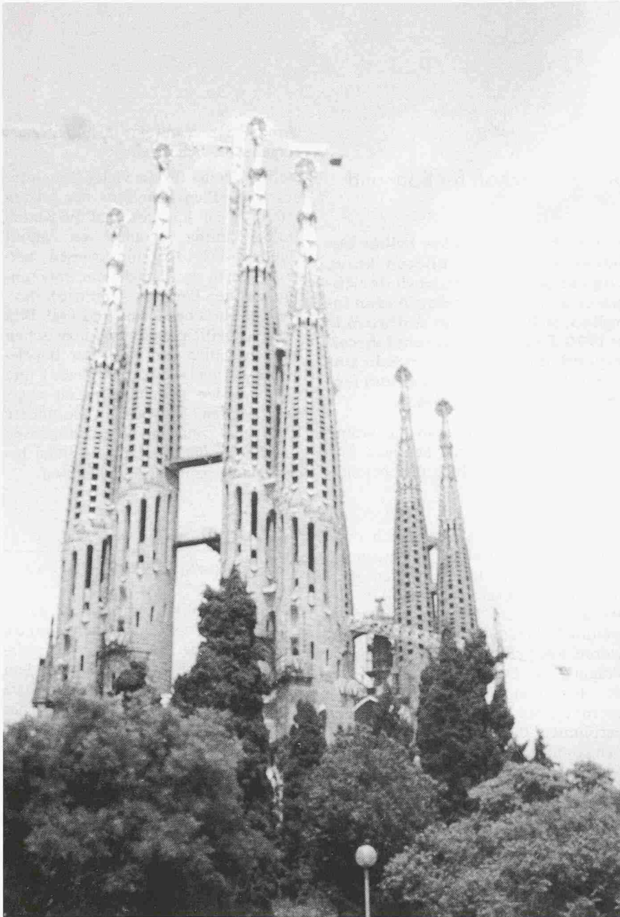
Bild 2. Familia Sagrada: «Jahrhundert-Bauwerk» von Arch. Gaudí (1852–1926). Bau-beginn 1884, stetige Baufortführung bis heute

Stadt enorme Impulse und einen fast beneidenswerten (wenn man etwa an die Mangelercheinungen in der Stadt Zürich denkt) Zukunftsglauben verleihen. Es ist erstaunlich, mit welchem Elan und welcher Unbeschwertheit neue städtebauliche Akzente gesetzt werden, die langfristig nachhaltige Auswirkungen nach sich ziehen – teils durchaus positive, teils aber auch fragliche. Zurzeit ist jedenfalls eine unheimliche Menge von Aktivitäten ausgelöst worden, welche die Wirtschaft mit einem auf die Olympiade abgestützten «Zukunftskredit» zweifelsohne in starkem Mass belebt. Es bleibt zu hoffen, dass letztlich die Rechnung unter dem Strich – einschliesslich der Sekundärwirkungen – aufgeht.