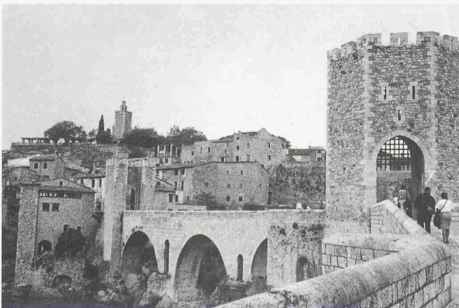
Bild 4. Besalu, Aussicht von der Zugangsbrücke