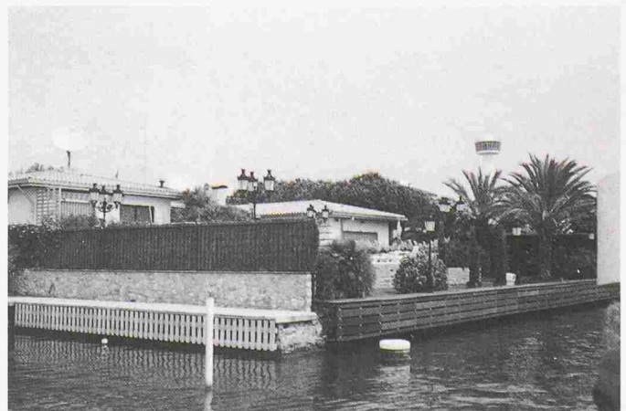
Bild 5. Empuria-Brava: Dilemma zwischen freiem Wasserzugang und «Abschottung»