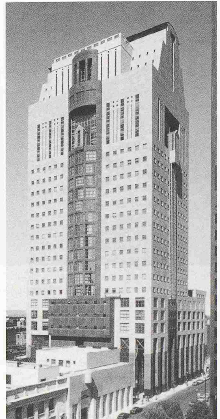
Graves' bekanntestes Werk: das Humana Building in Louisville, Kentucky