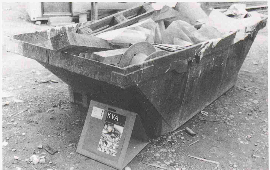
Bauschutt wird in gekennzeichneten Mulden konsequent getrennt gesammelt

Statt auf die Einrichtung einer grösseren Bauschutt-Sortieranlage zu warten, haben in Winterthur Vertreter von Bauhaupt- und -nebegewerbe, von Planern, Transporteuren, Entsorgungs- und Recyclingfirmen zusammen mit der Behörde an einem Tisch Platz genommen und nach einer alternativen Lösung gesucht. Das Ergebnis dieser intensiven Zusammenarbeit ist ein wegweisendes, umweltgerechtes Konzept zum konsequent getrennten Sammeln der Baurestmassen auf den Baustellen. Die Mittel dazu werden anfangs 1991 realisiert sein, ab dann wird das ge-