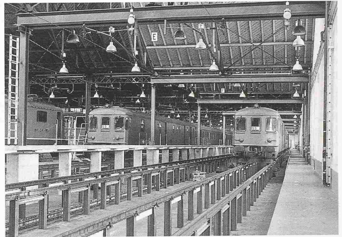
Bild 2. Neue Unterhaltsstände im bestehenden Depot F in Zürich

fallenden Reparaturen des Kurativ-Unterhalts S1 (technische Schäden und Störungen) und S2 (betriebliche Schäden infolge Zusammenstößen, Entgleisungen, Vandalenschäden usw).