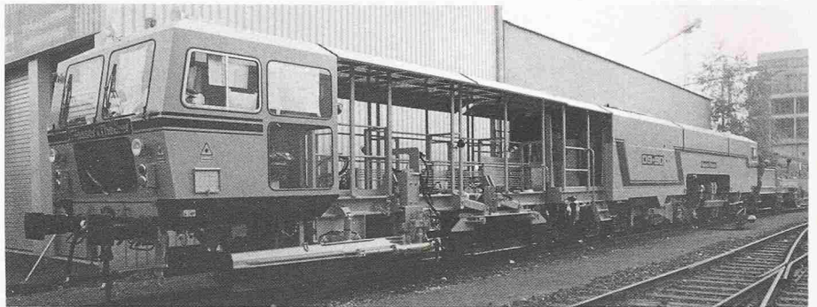
Bild 6. Stopfmaschine mit automatischer Schotterprofilierung (09-90)