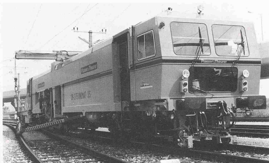
Bild 8. Universal-Stopmaschine für die Durcharbeitung von Gleisen und Weichen (Unimat 08-275)