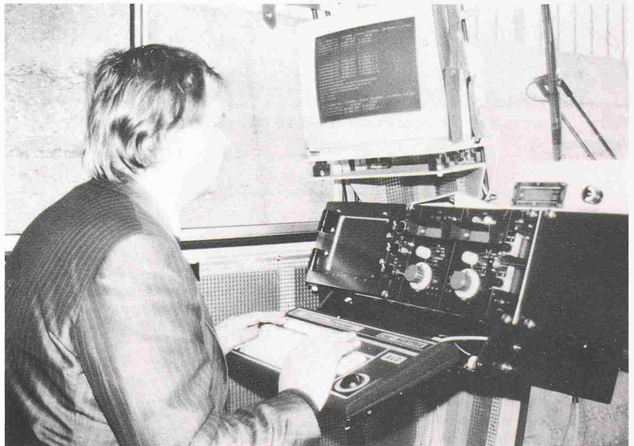
Bild 7. ALC-Zeitcomputer für Gleisstopfmaschinen

chem Heben überbeansprucht würde, hat man die «Synchrone 3-Strang-Hebung» entwickelt; dazu wurde die neue Weichenstopfmaschine mit einem nach beiden Seiten schwenkbaren Teleskop-Auslegerarm und Hebezeug mit einer Rollenzange für den abzweigenden äus-