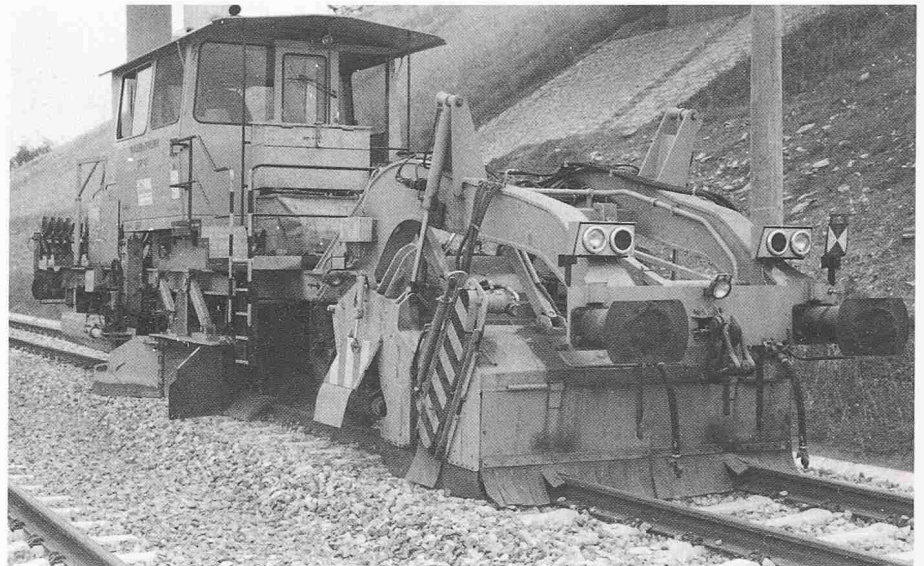
Bild 5. Hochleistungs-Schotterplanier- und -profiliermaschine für Gleise (SSP 110) und Weichen (SSP 110 SW) – mit Schottersilo

Die neueste Entwicklung bei den Weichenstopfmaschinen (Bild 8) stellen die verstellbare Stopfpickel-Eingriffsbreite und kombinierte Hebe- und Richtvorrichtungen mit Heberollen und Hebehaken für den Weichen- und Gleisangriff dar. Da beim Stopfen der schweren Weichen auf Betonschwellen Hebekräfte bis 200 kN auftreten können, wobei das Zweiggleis bei nicht zeitglei-