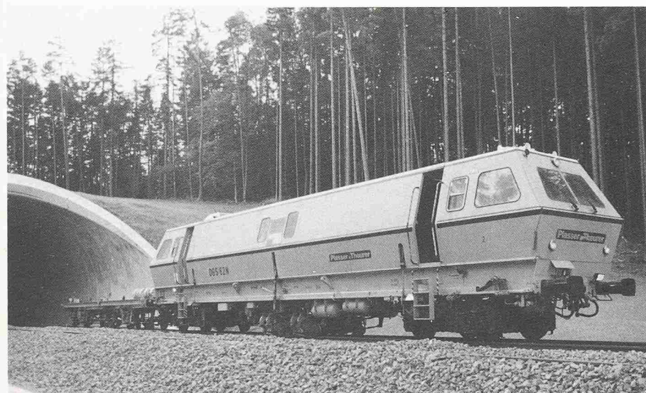
Bild 9. Dynamischer Gleisstabilisator (DGS-62 N) mit Messanhänger und 6-Kanal-Schreiber

Mit dem Dynamic-Stabilisator (60 t; 0/45 Hz) (Bild 9) kann man schnell, massgerecht und kontrolliert Setzungen eines Gleises herstellen, um die Gleislage nach einem Umbau zu verbessern und vor allem bei hoch beanspruchten Gleisen den Seitenverschiebe-Widerstand zu erhöhen (+40% gegenüber einem neugestopften Gleis).