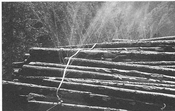
Bild 4. Nasslagerung von Rundholz in berieselten Poltern ist eine ökologisch sinnvolle Konservierungsmethode

gewiesen. Sie müssen aber, insbesondere beim Vergleich verschiedener Materialgruppen, mit in die Entscheidungsfindung einbezogen werden.