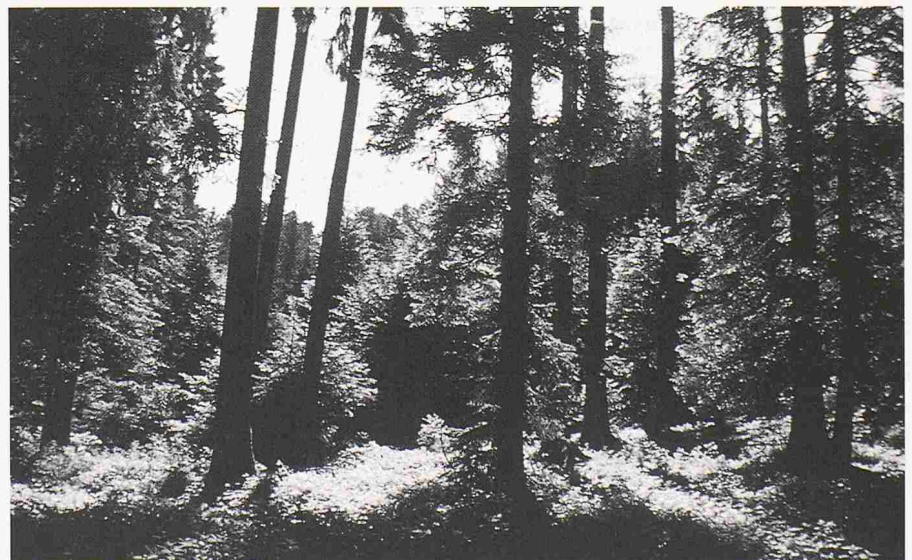
Bild 2. Holz wächst in Schweizer Wäldern natürlich und nachhaltig