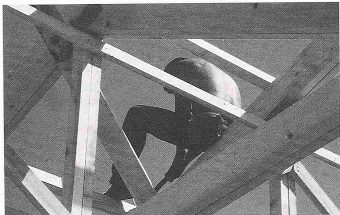
Bild 3. Holzverwendung in dauerhaften Konstruktionen bindet grosse Mengen \text{CO}_2 und entzieht sie dem \text{CO}_2 -Kreislauf