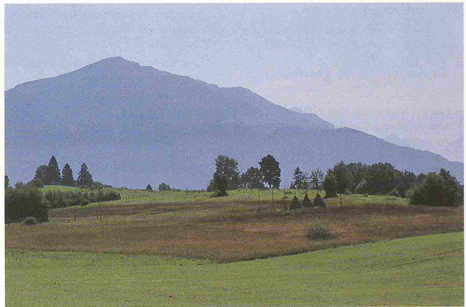
Flachmoorlandschaft Zugerberg, ZG; im Hintergrund der Tristen