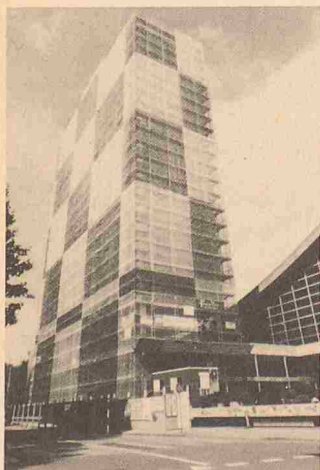
Beim Kongresshaus Biel werden Gerüstschutznetze zum Kunstobjekt