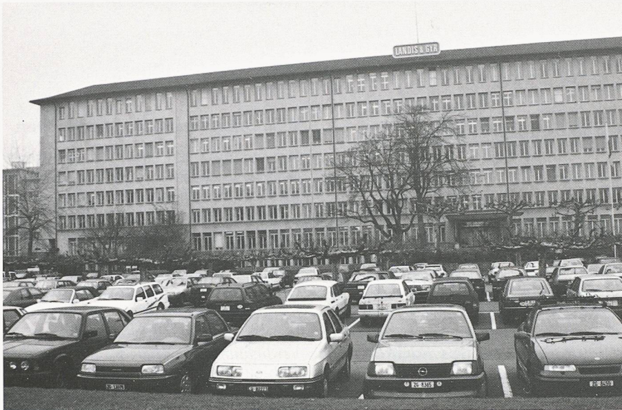
Bild 1. Parkfelder heute