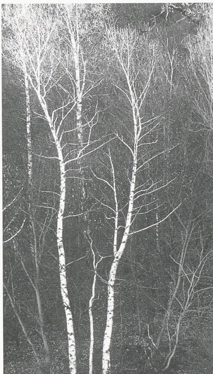
Anlässlich seines Jubiläums gab der SFV einen Bildband heraus, der durch 16 Schweizer Wälder führt: «Wurzeln und Visionen» (s. Kästchen). Das Bild stammt aus der Gemeinde A. Antonino, Kanton Tessin

Gefragt ist heute eine qualitativ hochwertige Lebensgemeinschaft Wald, die auch nachhaltige Schutzwirkung hat und Erholung bietet. Allerdings setzt naturnaher Waldbau naturnahe Wälder voraus, von deren Artenzusammensetzung und Aufbau man – nach den vielerorts in Monokultur wiederaufgeforsteten Wäldern des letzten Jahrhunderts – teilweise noch weit entfernt ist. Hier liegt eine der grossen Aufgaben für die Forstwirtschaft der Zukunft.