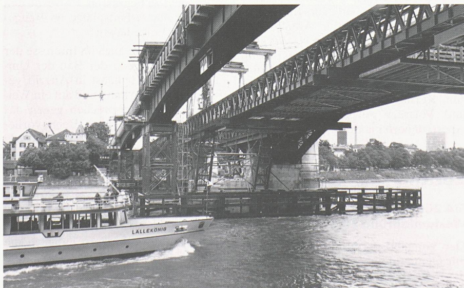
Die Hilfsbrücke links übernimmt während der Bauzeit der Basler Wettsteinbrücke den Autoverkehr. Deutlich sichtbar um den Brückenpfeiler: der Rammenschutz gegen Schiffs-kollisionen

Der im Herbst 1992 lancierte und mit Fr. 500 000.– dotierte Wettbewerb der Schweizerischen Akademie der Technischen Wissenschaften (SATW) stösst auf reges Interesse. Im Anschluss an eine kürzliche Informationstagung in Bern mit über 35 Interessenten aus dem In- und Ausland wurden die Wettbewerbsbedingungen erläutert und zum Teil präzisiert. So wurden unter anderem einheitliche Kalkulationssätze und Berechnungsmethoden für die Wirtschaftlichkeitsanalyse festgelegt. Es wurde beschlossen, dass allfällige neue und in den Wettbewerbsbedingungen nicht aufgeführte Energiequellen berücksichtigt werden können. Das ausführliche Protokoll der Informationsveranstaltung mit den Ergänzungen zu den Wettbewerbsbedingungen kann bezogen werden beim Sekretariat der SATW, Selnastrasse 16, Postfach, 8039 Zürich, Tel. 01/283 16 16.