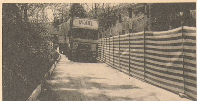
Das rot-weiss gestreifte Tegutex 604 übt eine starke Signalwirkung aus