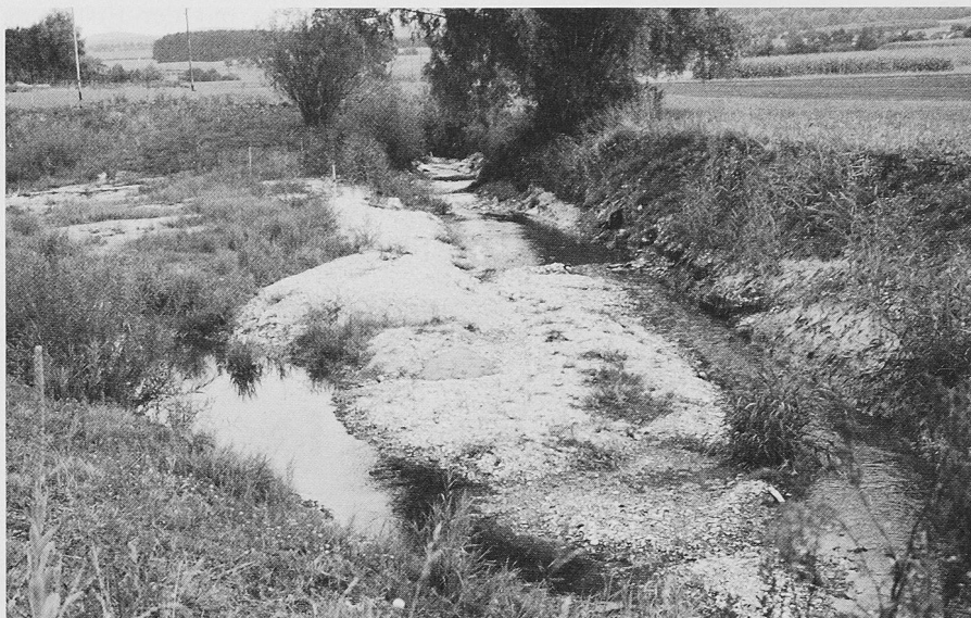
Bild 3. Die vormals kanalisierte Lauche nach der Renaturisierung

Verheerende Überschwemmungen in den sechziger und siebziger Jahren führten zum Schluss, dass die Thur, der Hauptfluss unseres Kantons, hochwas-