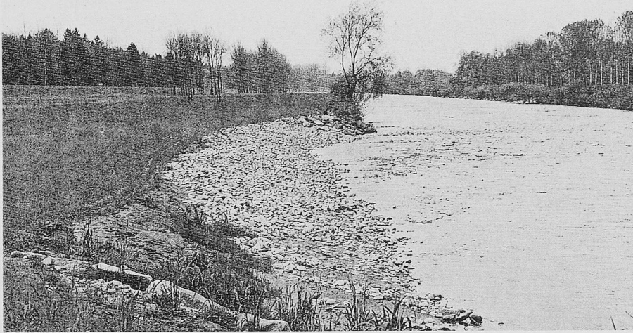
Bild 2. Wiederhergestellte Hochwassersicherheit der Thur unterhalb von Frauenfeld – naturnah

ben sich in der Praxis auswirken können.