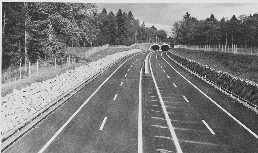
Bild 1. N7 Müllheim-Kreuzlingen mit sogenannter Grünbrücke

Die Umweltverträglichkeitsprüfung soll im Laufe eines Entscheidungsprozesses ja nichts anderes als die vollständige Erfassung aller relevanten Fakten organisatorisch sicherstellen und damit letztlich eine umfassende Abwägung aller beteiligten Interessen überhaupt erst ermöglichen. Letztlich wird es immer von den am Verfahren beteiligten Personen abhängig sein, ob die UVP zu einem ungeliebten Verfahrensballast werden wird oder ihre Wirkung im Sinne der Vorsorge auch tatsächlich entfalten können. Als Lehre aus den bisherigen UVP hat sich immerhin gezeigt, dass die mit solchen Aufgaben betrauten Büros zum Perfektionismus neigen, Sachen abklären, die eigentlich nicht nötig sind und damit den Bauherrn in unnötige Kosten stürzen. Eine UVP ist ohnehin ein finanziell derart aufwendiges Instrument, dass man mit einem realitätsbezogenen Pflichtenheft für Kostensenkungen sorgen kann und muss.