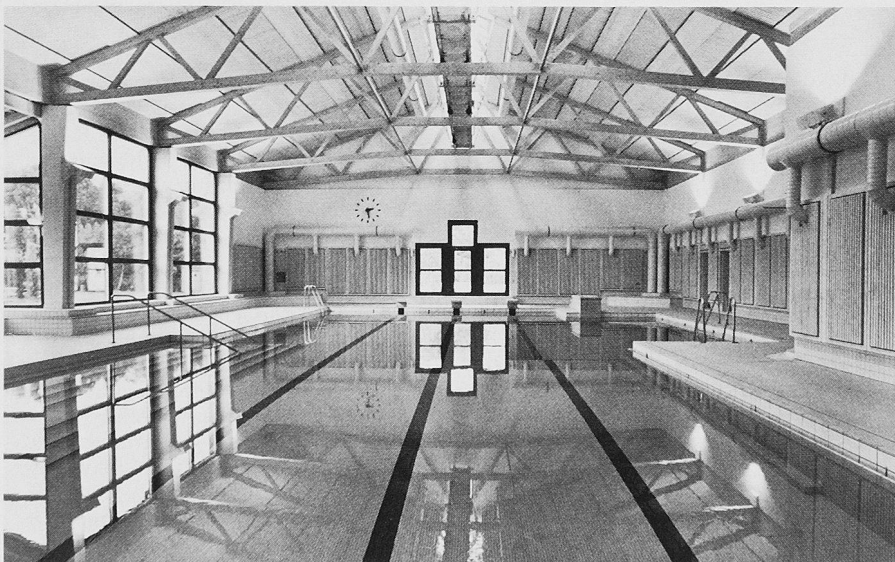
Bild 3. Hallenbad Rheinau, nach der Sanierung