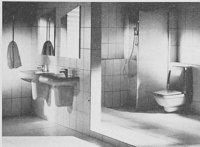
Mit dem neuen Geberit-GIS-Installationssystem können ungewohnte Ideen auf unkomplizierte Weise realisiert werden – einfach und schnell, ohne Schutt, Baulärm und Staub

rung an eine Menge Unannehmlichkeiten während der Bauzeit. Nun schafft ein neues Vorwandssystem Abhilfe. Mit dem flexiblen GIS-Installationssystem von Geberit müssen Zu- und Ableitungen nicht mehr mit viel Aufwand, Schmutz und Lärm in bestehende Wände verlegt werden. Jetzt kann der Sanitärfachmann die notwendige Technik genau dort plazieren, wo der