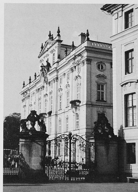
Eingang zum Hradštin