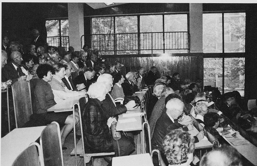
Die GEP-Delegation am Hochschultag an der Tschechischen Universität