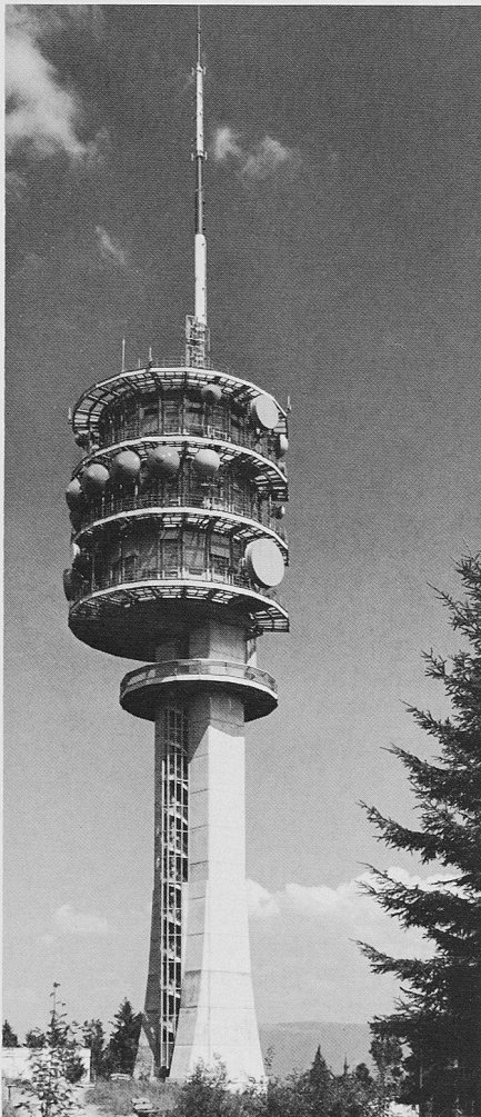
Auf dem Mont Gibloux im Kanton Freiburg entstand ein neuer Pfeiler im nationalen Fernmeldenetz, ein Bauwerk mit gut durchdachter Architektur

Eine öffentlich zugängliche Panoramaterasse befindet sich 37 m über Boden und bietet den Besuchern eine phantastische Rundschau auf das Greyerzer- und Freiburgerland, die Romandie zwischen Alpen und Jura. Der voll ausgestattete Konferenzraum im obersten Stockwerk kann bis zu 30 Personen für Seminare zwischen Himmel und Erde aufnehmen.